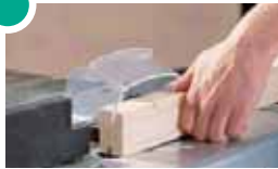
6114 000 Lengtefreesaanslag