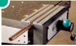
6171 000 Inlegstukken voor bankschroef