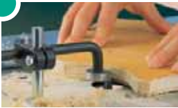
6115 000 Rondfreesaanslag