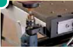
6152 000 Machinehouder