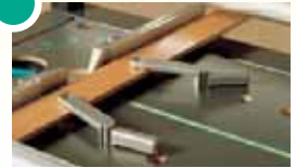
6176 000 Schnellspanner