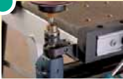
6152 000 Maschinenhalter