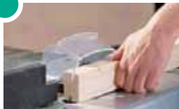
6114 000 Längsfränschlag