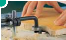
6115 000 Kurvenfränschlag