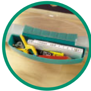
Verschließbares Depot für Kleinteile.

Durch die kompakten Abmessungen einfach zu verstauen und immer schnell zur Hand. Passt in alle Norm-Küchenschränke.